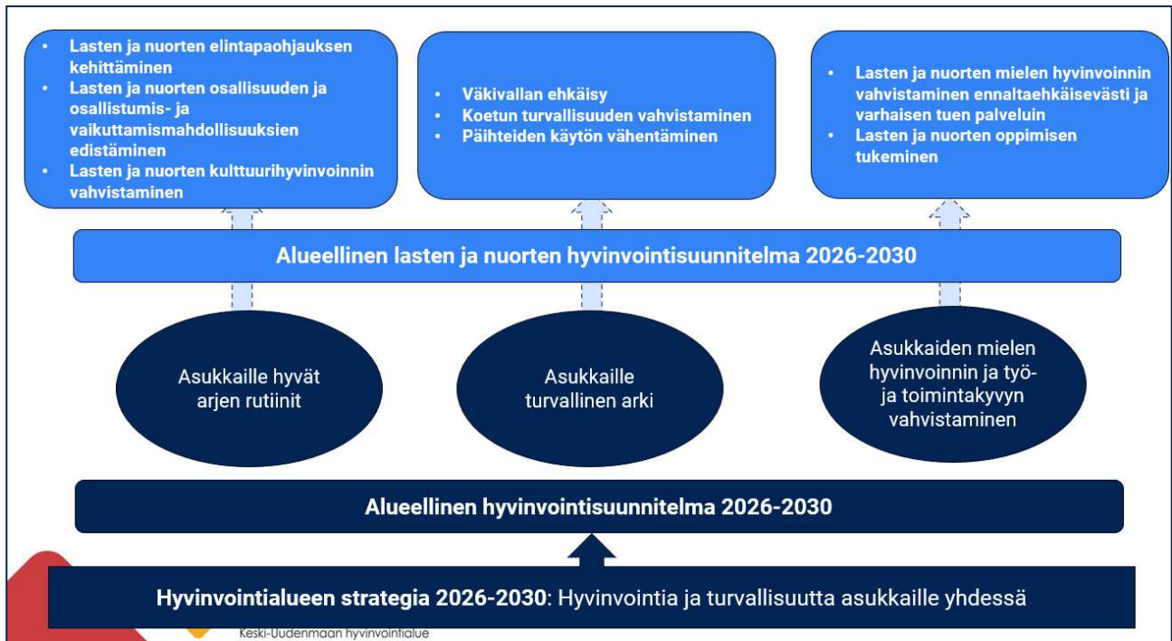
Kuva 7. Alueellinen lasten ja nuorten hyvinvointisuunnitelma 2026–2030