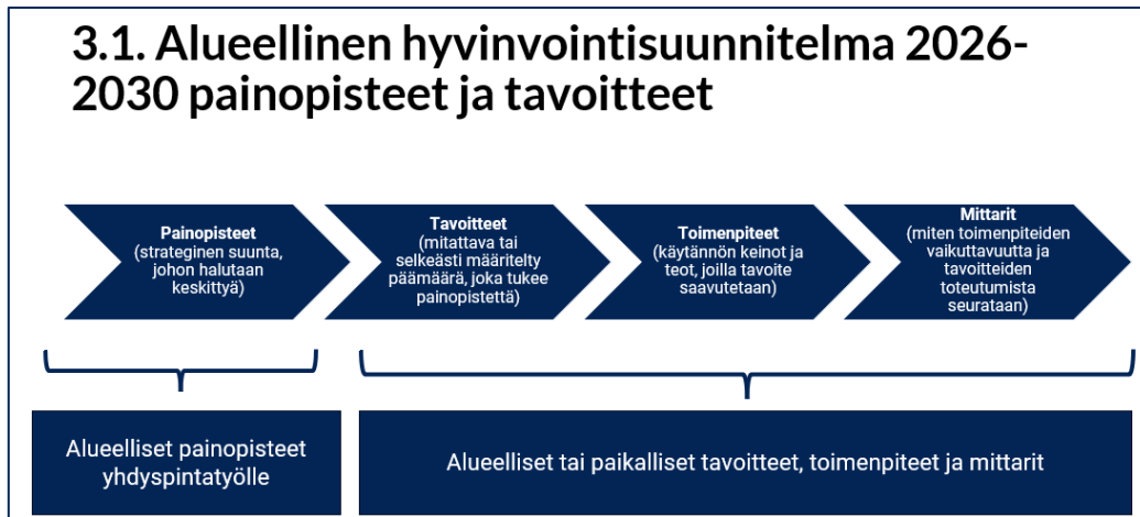
Kuva 6. Alueellisen hyvinvointisuunnitelman 2026–2030 rakenne

Alueellisen lasten ja nuorten hyvinvointisuunnitelman 2026–2030 painopisteet ja tavoitteet: