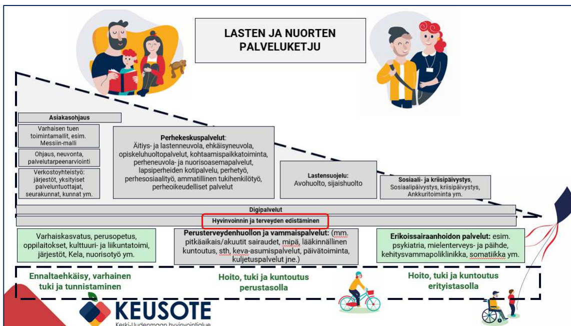
Kuva 1. Keski-Uudenmaan hyvinvointialueen lasten ja nuorten palveluketju

Hyvinvoinnin ja terveyden edistäminen on osa jokaista Keski-Uudenmaan hyvinvointialueen palveluketjua. Hyvinvoinnin ja terveyden edistäminen toimii palveluketjuissa läpileikkaavana periaatteena niin varhaisessa ennaltaehkäisevässä tuessa, hoidossa, kuntoutuksessa ja tuessa perustasolla sekä hoidossa, kuntoutuksessa ja tuessa erityistasolla. Keskeistä palveluketjukohtaisessa hyvinvoinnin ja terveyden edistämässä ja toteutuksessa on monialaisuus ja kumppanuus. Palveluketju kattaa myös yhdyspintoimijat ja se ulottuu esim. kouluihin, kuntien liikunta- ja kulttuuripalveluihin, järjestöihin ja yrityksiin. Palveluketjuissa korostuu myös asukkaan, asiakkaan ja potilaan aktiivinen rooli oman hyvinvointinsa ja terveytensä edistämässä. Palveluketjujen osalta hyvinvoinnin ja terveyden edistämisen toteutumista seurataan määritetyin mittarein, esimerkiksi hyvinvointialueiden hyte-kerroin mittarit sekä kansalliset eri ikäryhmien hyvinvoinnin tilaa kuvaavien mittarit.